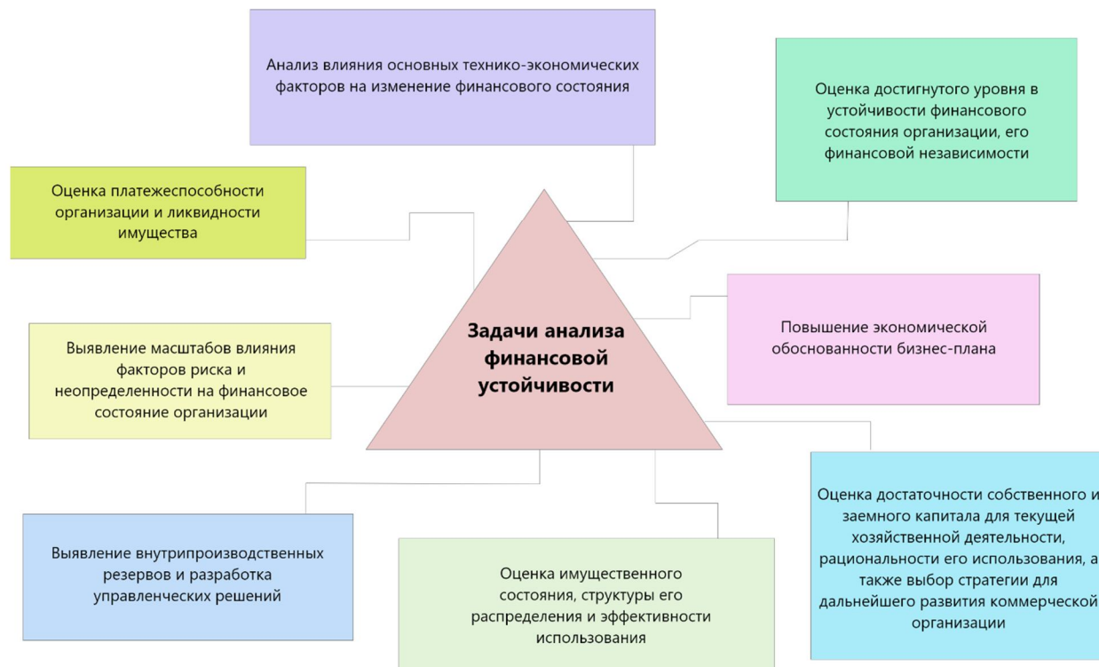
Рис. 2. Задачи анализа финансовой устойчивости коммерческой организации

Устойчивое финансовое положение в свою очередь оказывает положительное влияние на выполнение производственных планов и обеспечение нужд производства необходимыми ресурсами в условиях риска и неопределенности. Поэтому финансовая деятельность как составная часть хозяйственной деятельности должна быть направлена на обеспечение планомерного поступления и расходования денежных ресурсов, выполнение расчетной дисциплины, достижение рациональных пропорций собственного и заемного капитала и наиболее эффективное его использование. Рассмотрим более подробно основные задачи анализа финансовой устойчивости коммерческой организации (см. рис. 2).